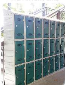
RESISTENTES A LA INTEMPERIE