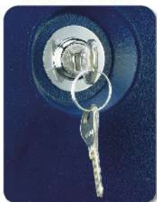
OPCIÓN CON LLAVE